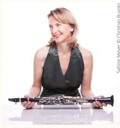
Sabine Meyer